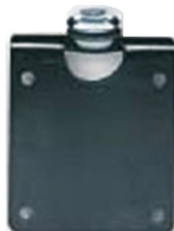
Viršutinis konstrukcijos ratukas.