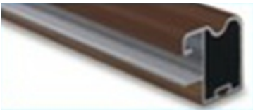
Aliuminis. ZEUS (EC 10) Tamsiai rudas (šokoladas). Padengimas: faneruotė.