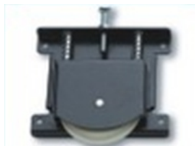
Guolinis apatinis konstrukcijos ratukas.